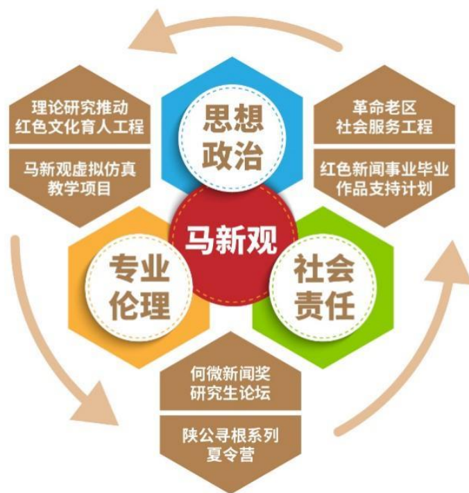
图1 “一核三维六平台”思政教育模式

筑六大育人平台，将封闭的校园课堂扩展为开放的社会课堂，理实并重、多维融合，全方位深化马新观教学内容、教学方式与评价方式改革，实现思政教育与专业教育的结合。